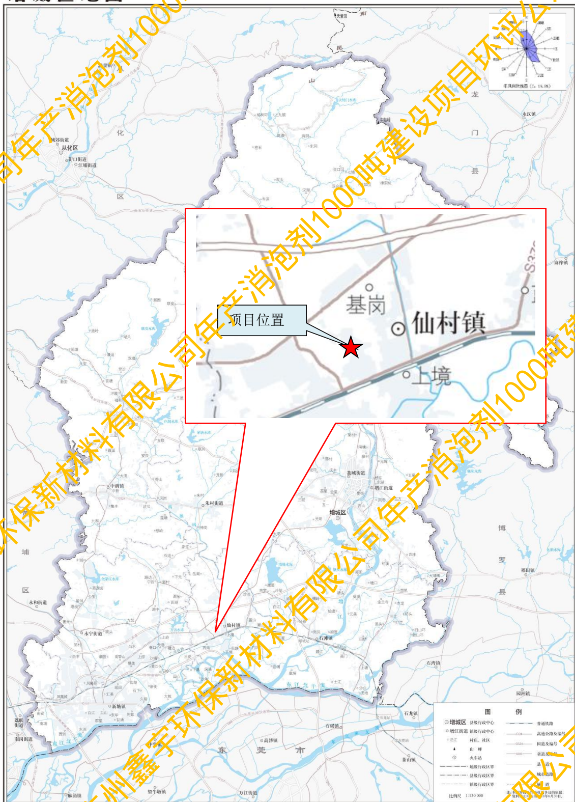
附图 1 建设项目地理位置图