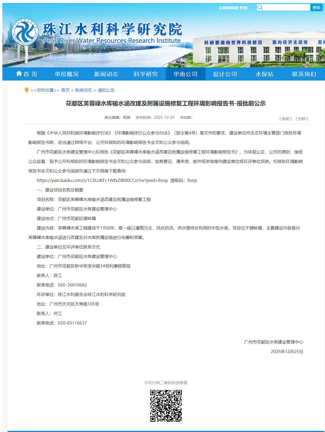
图 6.2-1 报批前公示截图