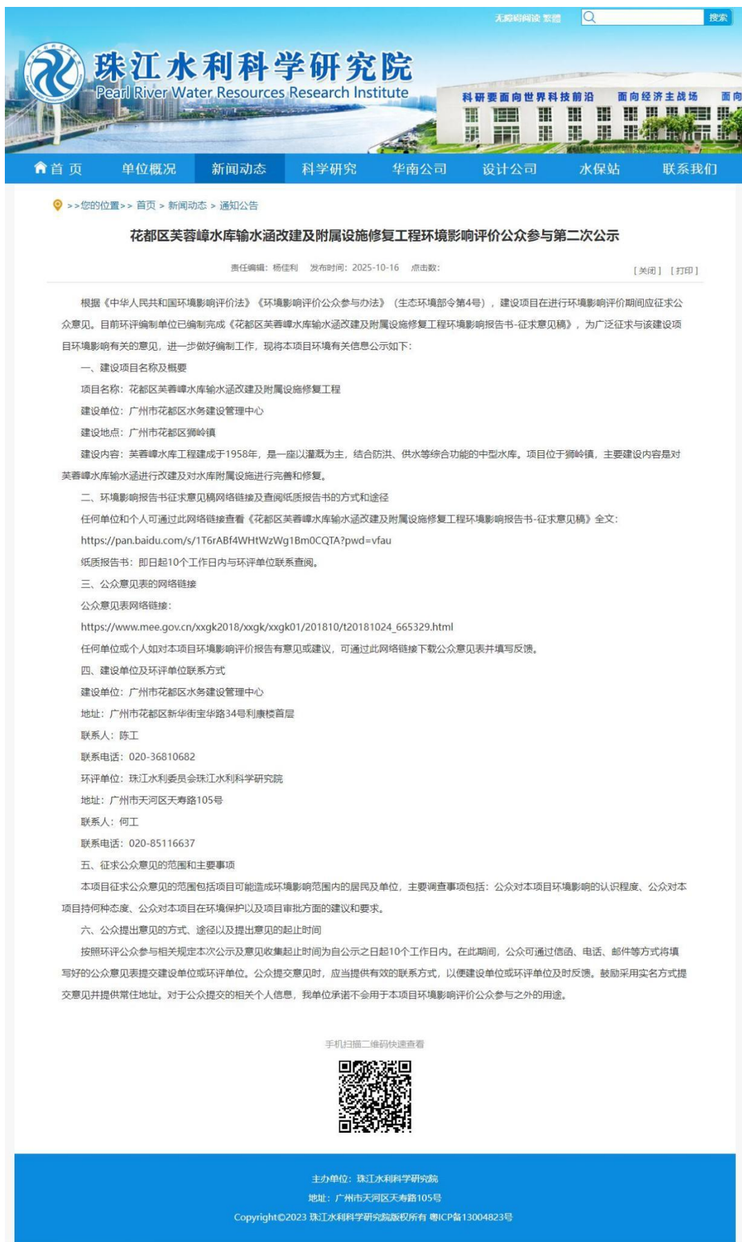
图 3.2-1 征求意见稿网上公示截图