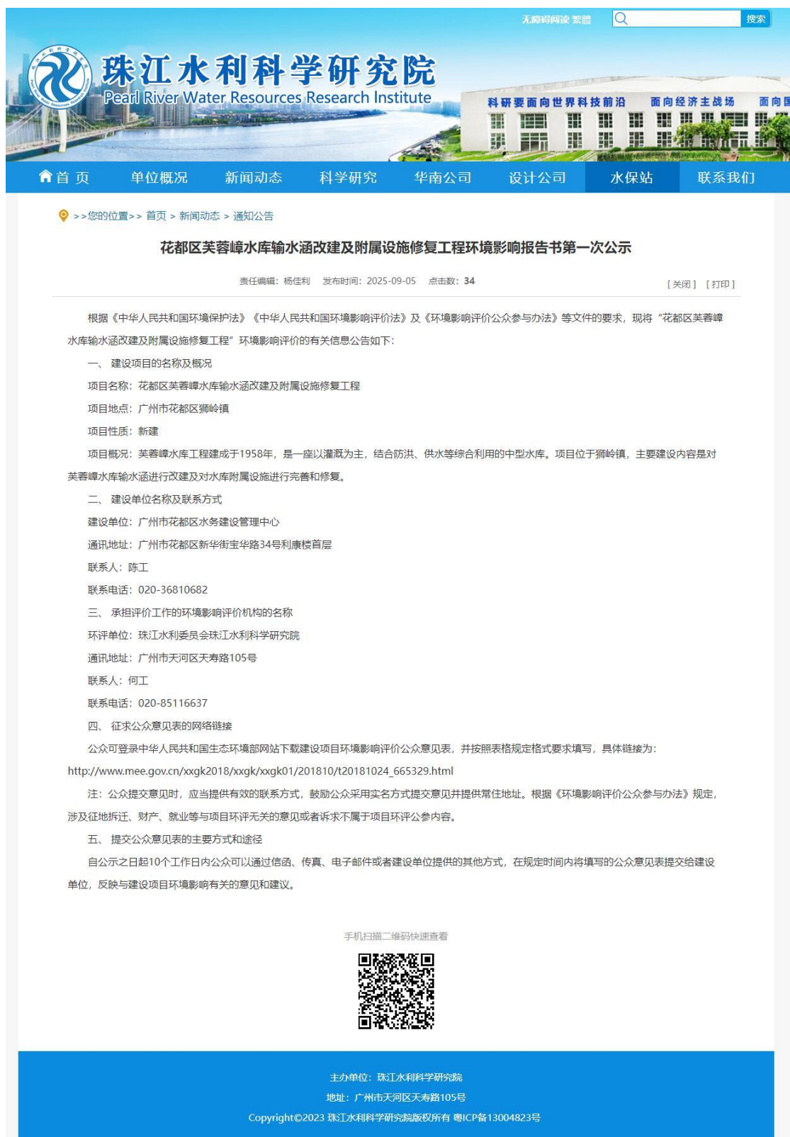
图 2.2-1 第一次网上公示截图