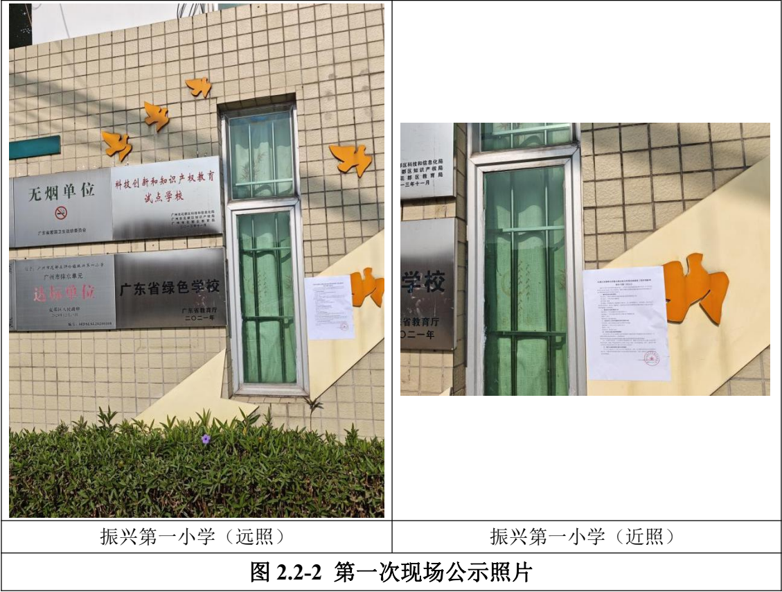
图 2.2-2 第一次现场公示照片