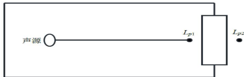
图 4-3 室内声源等效为室外声源图例