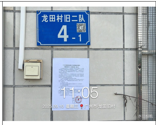
广州从鳌头镇化龙田旧村近景