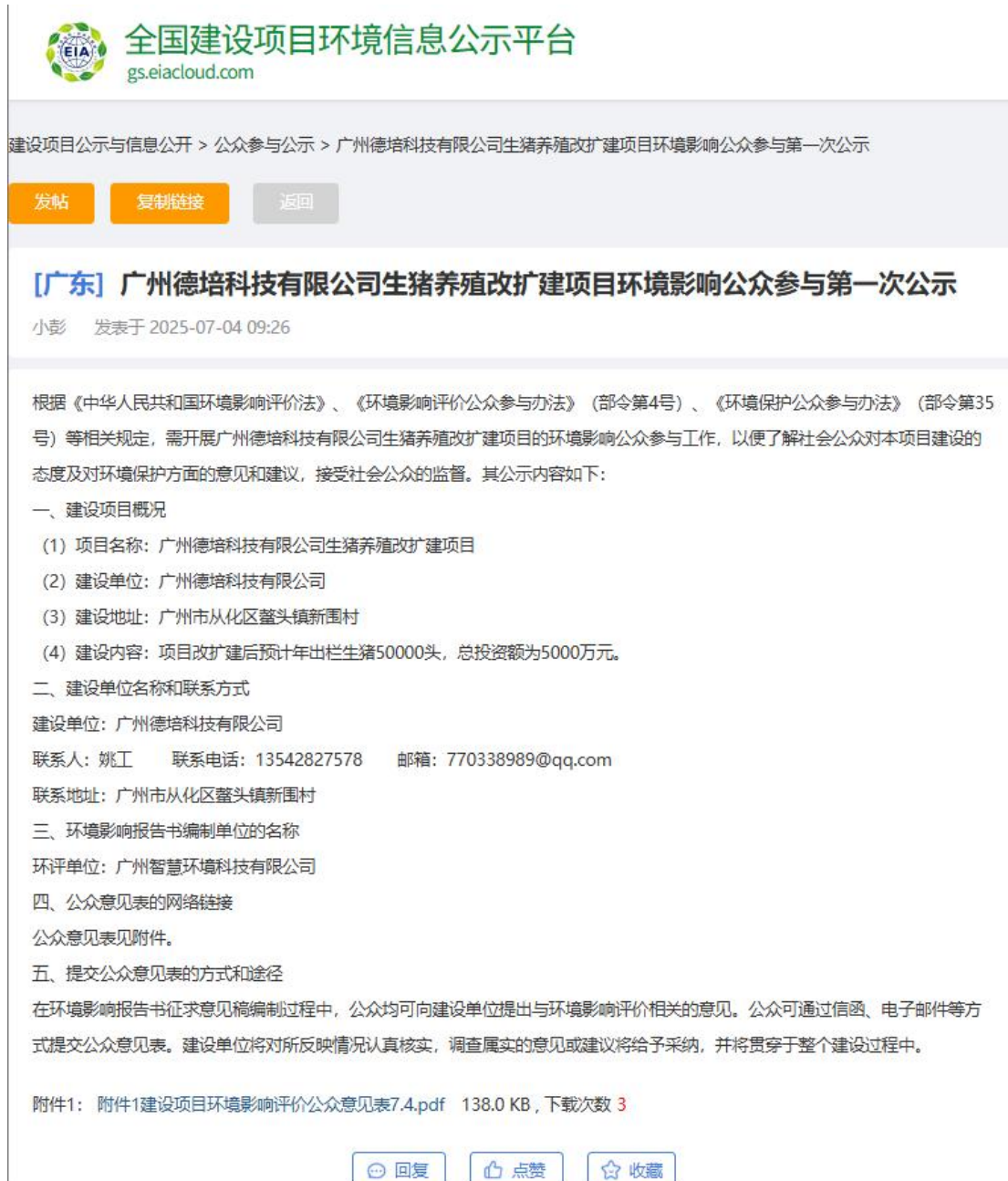
图 2-1 公众参与首次环境影响信息网上公开截图