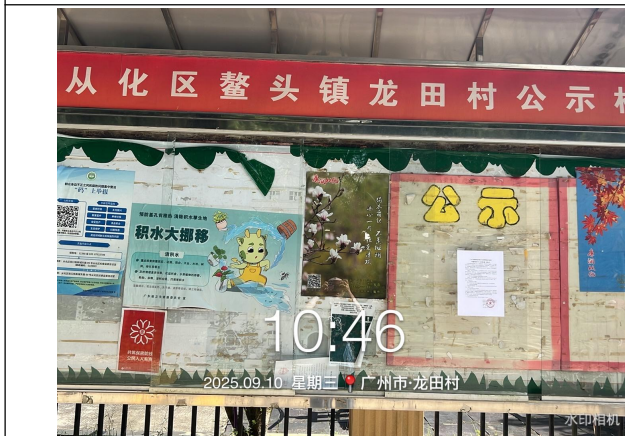
广州从化鳌头镇龙田村远景