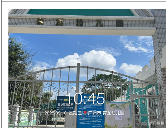
广州从化鳌头镇育龙幼儿园远景