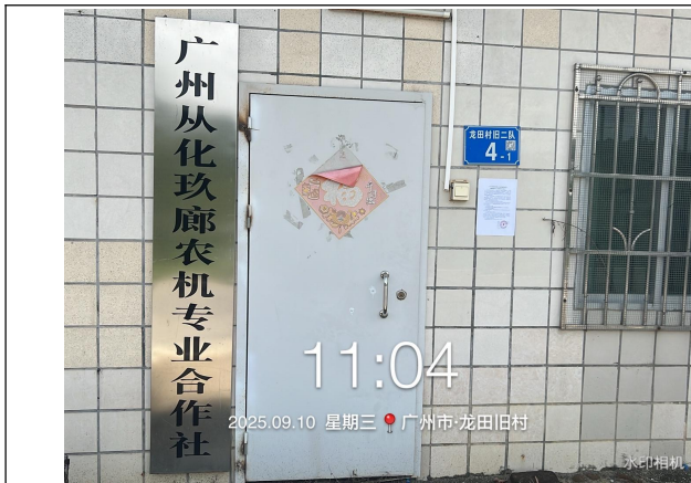
广州从鳌头镇化龙田旧村远景