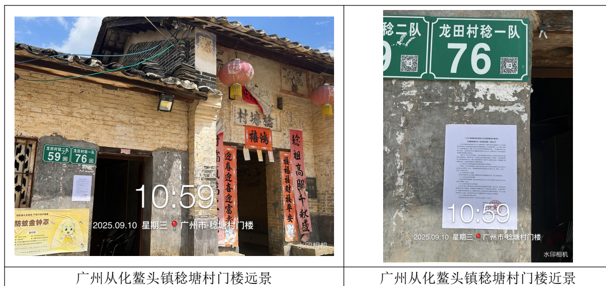
图 3-4 公众参与征求意见稿公开张贴公示照片