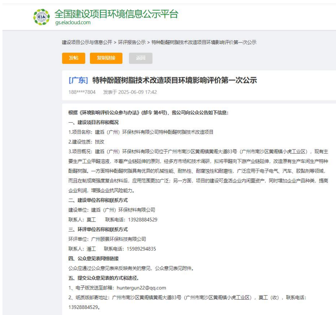
图 2-1 第一次网络公示截图