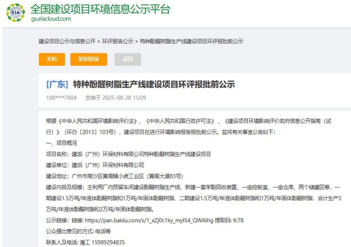
图 6-1 环评报告全本公示

本次报批前公示时，由于项目投资备案证备案需求，项目名称由原来“建滔（广州）环保材料有限公司特种酚醛树脂技术改造项目”变更为“建滔（广州）环保材