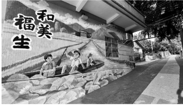
福生社区入口处墙绘与彩虹步道相得益彰

亮化工程不仅解决了实际问题，更让福生二桥焕发出新的活力。桥栏杆被涂上了明亮的彩虹颜色，与LED灯带交相辉映，桥面规划了红、黄、蓝三原色的彩色跑道，既美观又实用，满足了居民步行、慢跑和骑行的多样化需求。