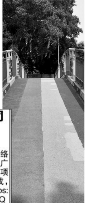
居民外出必经的彩虹桥。