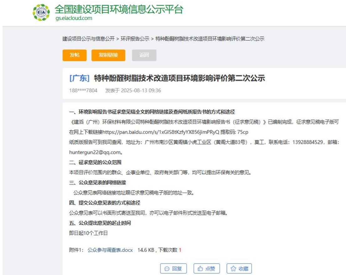
图 3-1 第二次网络公示截图