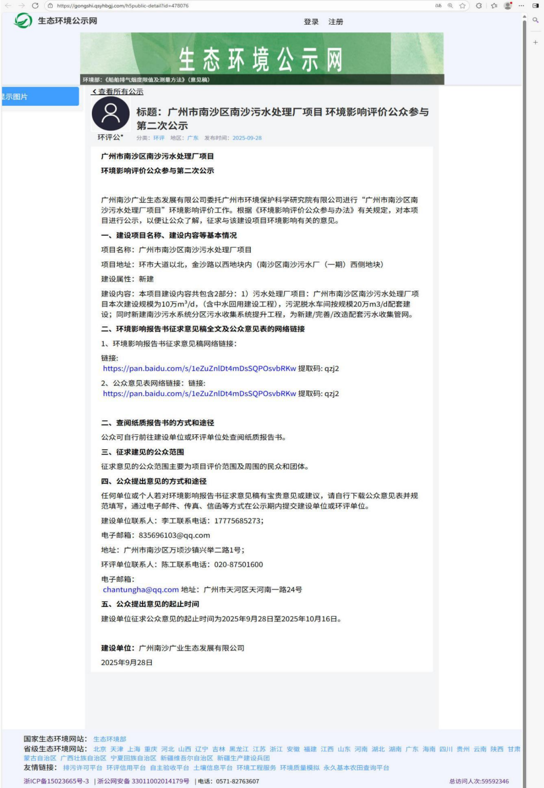
图 2 第二次网上公示截图

年 9 月 28 日至 2025 年 10 月 16 日（共 10 个工作日）网上公示连续 10 个工作日。因此本项目征求意见稿公示载体的选取符合《环境影响评价公众参与办法》要求。