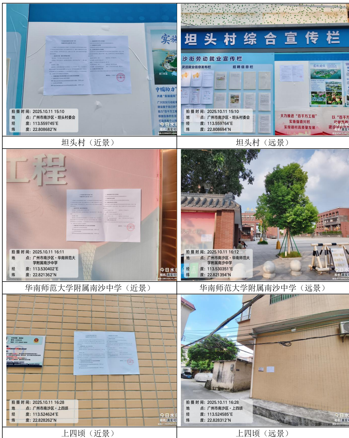
图 5 现场公示张贴情况照片