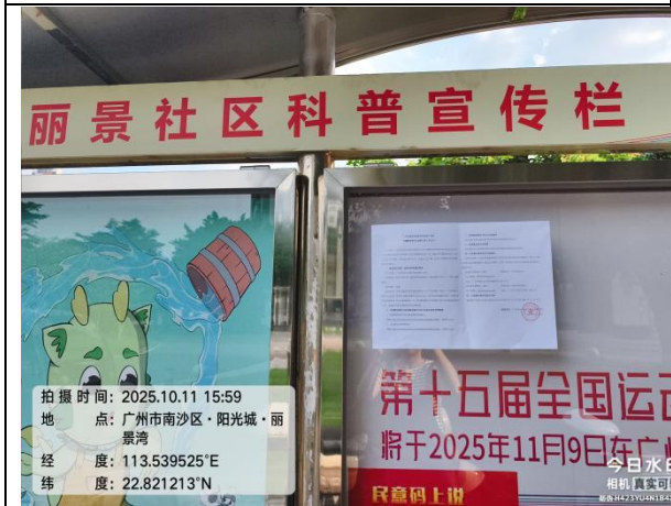
阳光城丽景湾（近景）