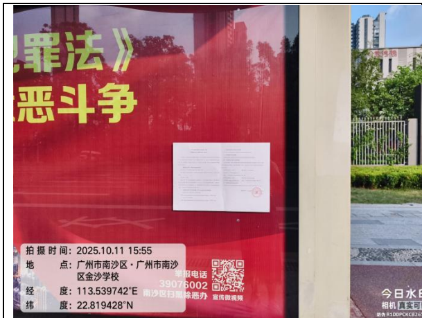
广州市南沙区金沙学校（近景）