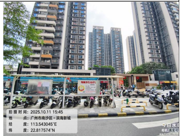
越秀海滨新城（远景）