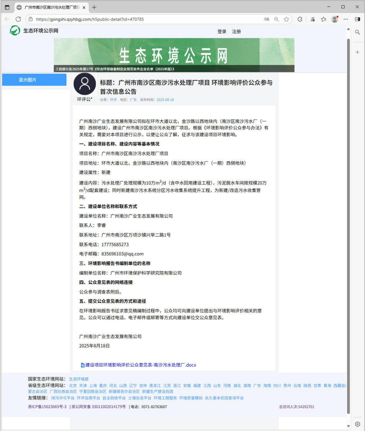
图 1 网上第一次公示截图