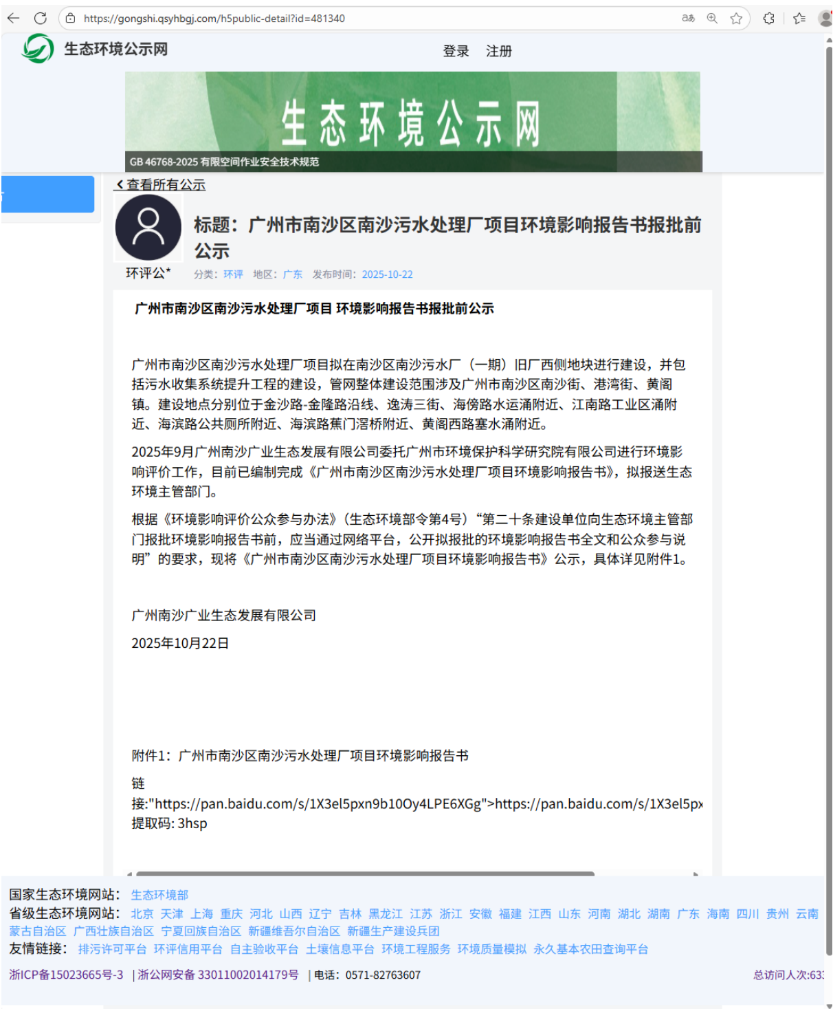
图 6 报批前网上公示截图

式采用生态环境公示网站，在报告书拟报送生态环境主管部门前，于 2025 年 10 月 22 日网上公示。本项目征求意见稿公示载体的选取符合《环境影响评价公众参与办法》要求。