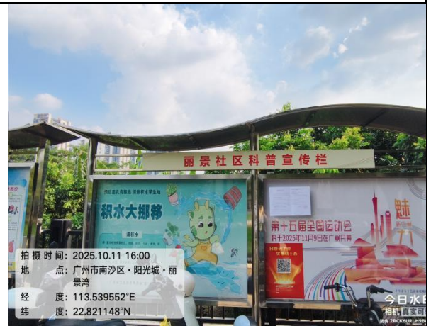
阳光城丽景湾（远景）