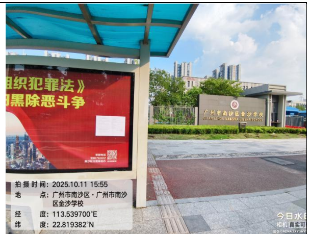
广州市南沙区金沙学校（远景）