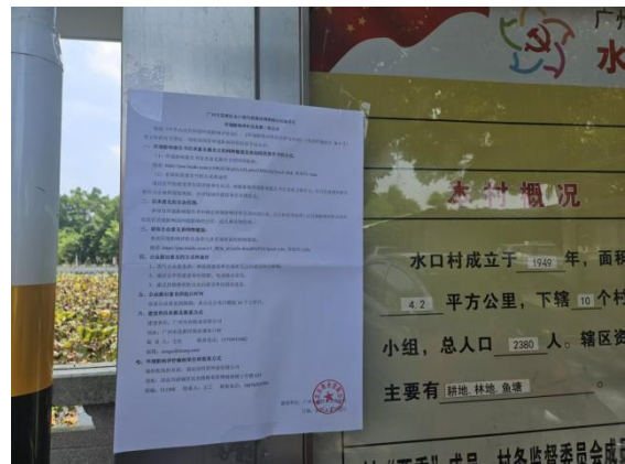
水口村公开栏张贴公告（近照）