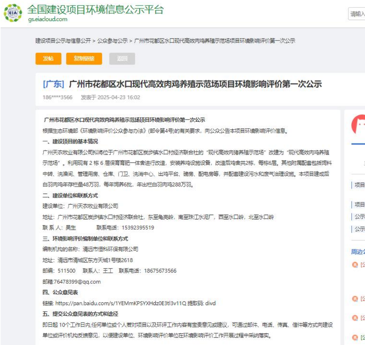
图 3.1-2 第一次网上公示截图