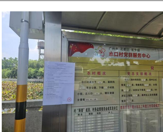
水口村公开栏张贴公告（远照）