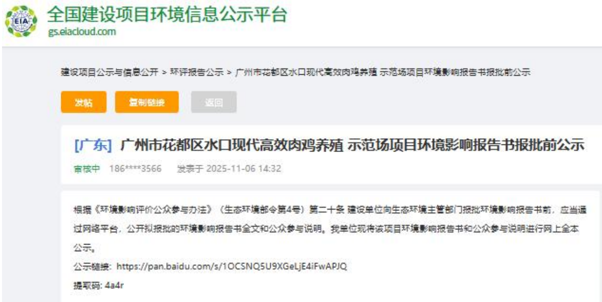
图 6-1 环境影响报告书报批前公示截图

根据《环境影响评价公众参与办法》（生态环境部令第4号）第二十条 建设单位向生态环境主管部门报批环境影响报告书前，应当通过网络平台，公开拟报批的环境影响报告书全文和公众参与说明。我单位现将该项目环境影响报告书和公众参与说明进行网上全本公示。