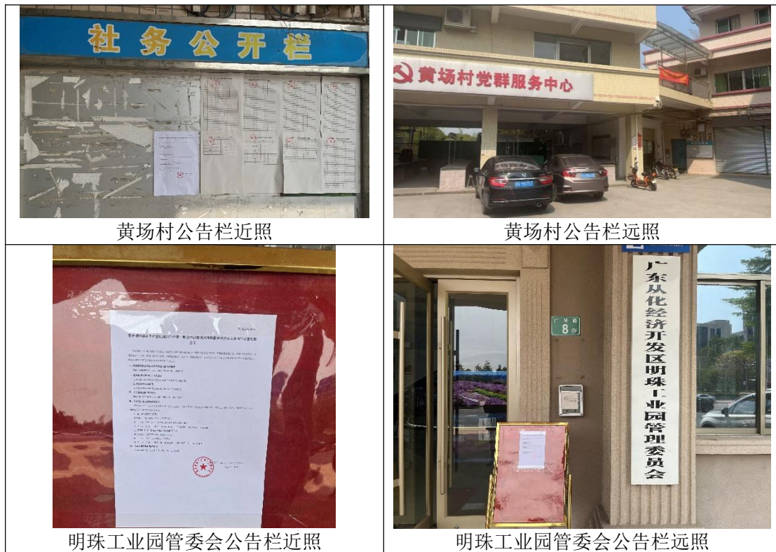
图 4 本项目征求意见稿公示张贴照片

张贴区域选取的符合性分析： 本项目环评征求意见稿公示选取本项目周边敏感点黄场村和本项目所在明珠工业园的管委会公告栏作为张贴区域，并于 2025 年 3 月 28 日~2025 年 4 月 11 日连续公示 10 个工作日，符合《环境影响评价公众参与办法》要求：通过在建设项目所在地公众易于知悉的场所张贴公告的方式公开，且持续公开期限不得少于 10 个工作日。