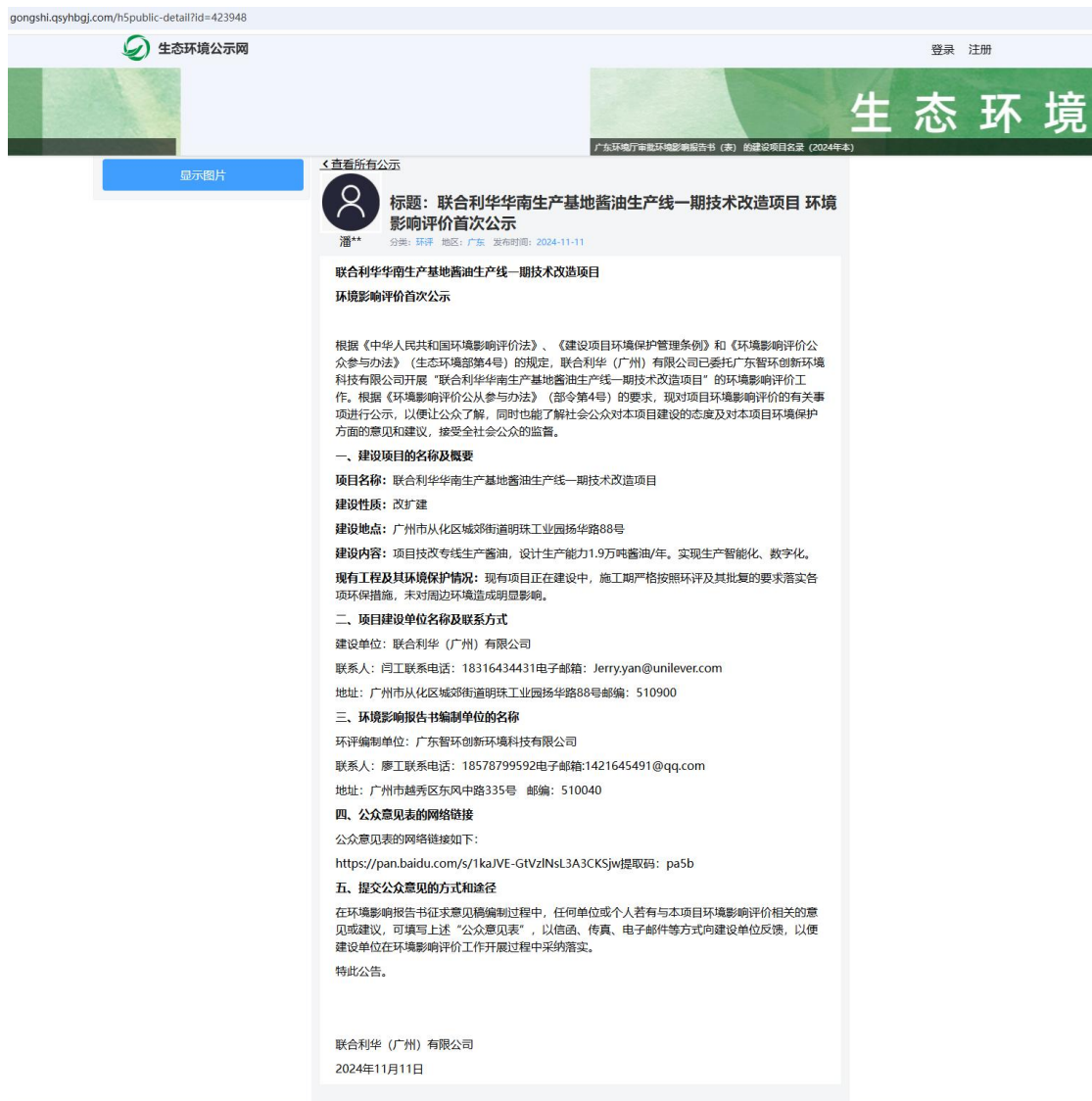
图 1 本项目首次环境影响评价信息公示截图