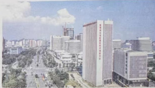
广州科学城，是广州开发区、黄埔区培育新质生产力的重要阵地。

根据实施细则，科创母基金新增投入部分不超过30%用于直投资金。直投资金以对项目开展直接股权投资为主要运作模式，包括种子直投、天使直投、产业直投，其中，种子直投、天使直投的金额合计不超过直投资金规模的30%，直投资金不得投资房地产、落后产能、高环境风险等类型项目。