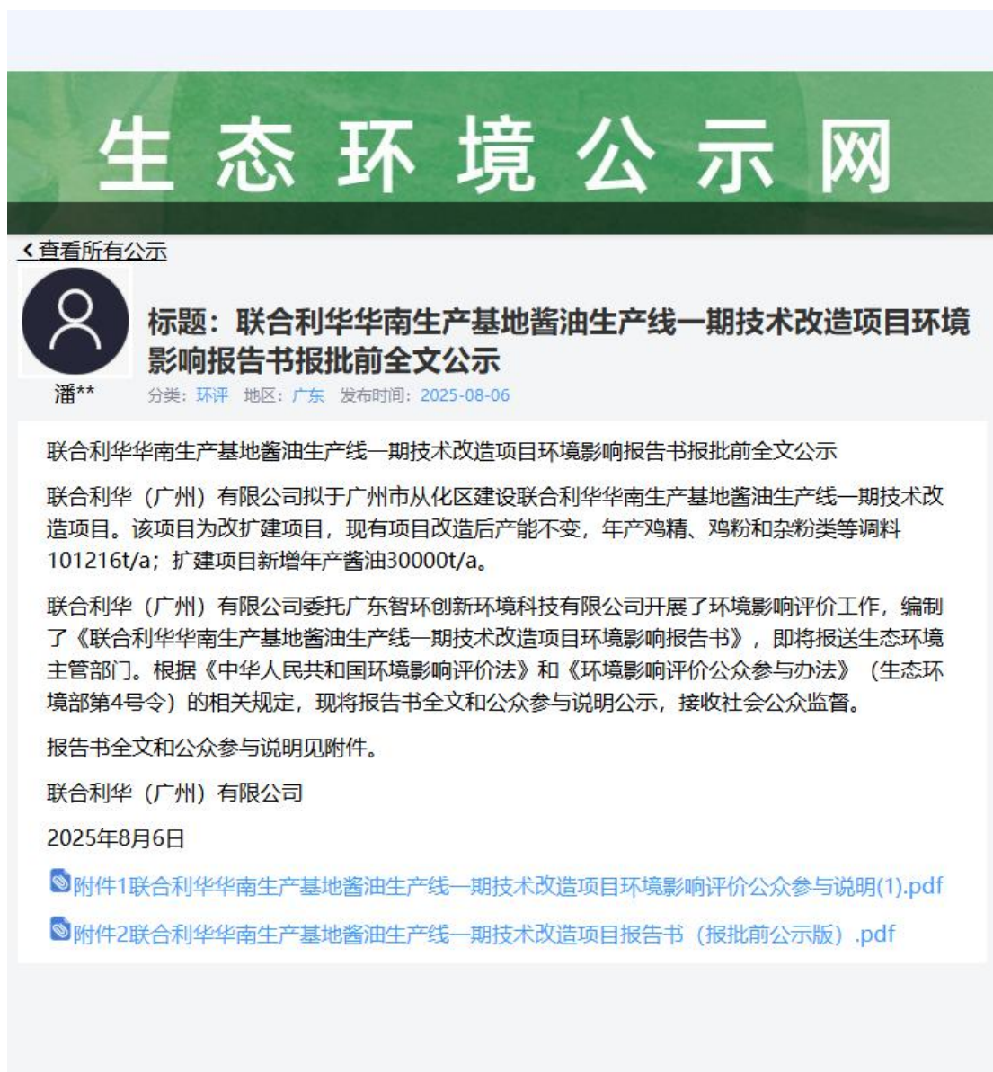
图 5 本项目报送前公示截图