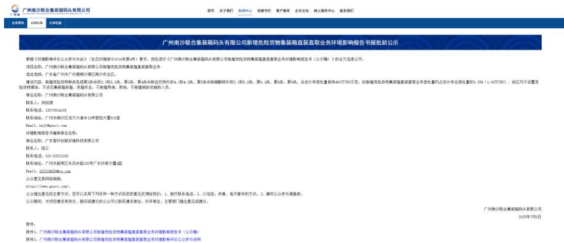
图 7-1 报批前网上公开截图