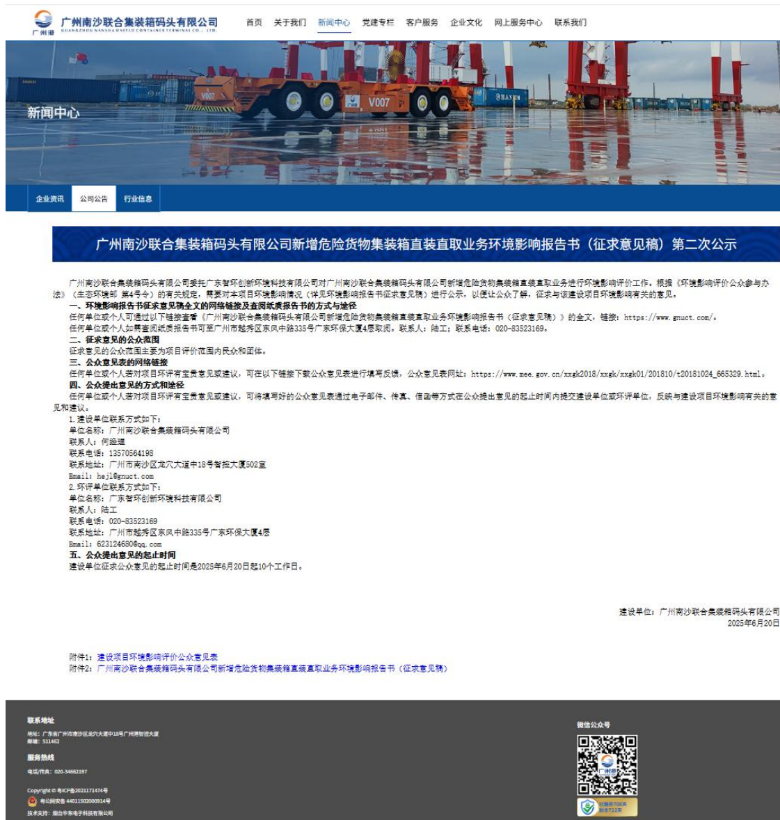
图 5-1 本项目征求意见稿环境影响评价信息网上公示截图