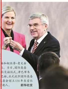
林和树(左)与考文士(右)在当日国际奥委会交接仪式上,考文士为林和树颁发国际奥委会创立131年来首任华人主席奖杯。

沪昆高铁杭长段是国家“八纵八横”高铁网沪昆通道的组成部分,线路全长924公里,途经浙江、江西、湖南,连接长三角城市群、环鄱阳湖生态经济区、长株潭城市群等。自2014年沪昆高铁杭长段建成通车以来,常态化按时速310公里达标运行。